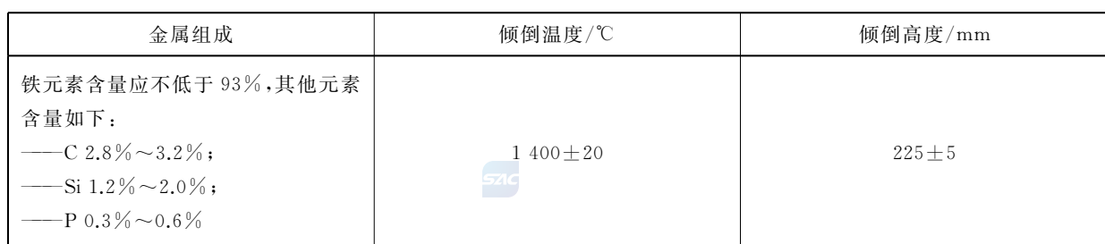
表 B.1 熔融金属组成及测试装置要求

B.3.1 将 150 g±10 g 的铁熔化至液体状态，将被测样品置于头模上，调整倾倒位置，使得液态金属倾倒点处于安全帽顶部中心半径 50 mm 范围内，一次性倾倒全部液态金属后检查样品状态。